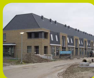
Impressie van de wijk